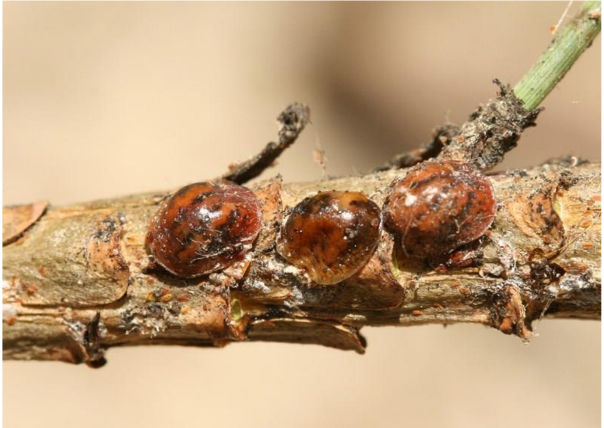
Fig. 1. Colonia di Toumeyella parvicornis su germoglio di pino domestico

Toumeyella parvicornis (Cockerell) è un insetto di origine americana, denominato Cocciniglia tartaruga del pino per la particolare morfologia del corpo delle femmine adulte, che ricorda un carapace di tartaruga, e perché vive sulle piante del genere Pinus .