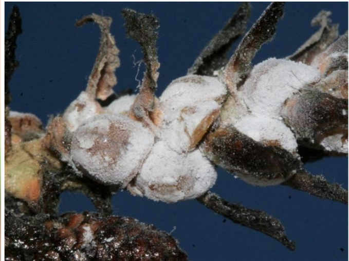
Fig. 2 Colonia con forme giovanili (neanidi) arancioni Fig. 3 Colonia ricoperta di cera